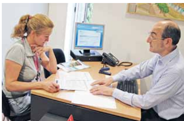
El responsable del servei atén una usuària.

Per grans temes, els casos que es va atendre durant l'any van correspondre a telecomunicacions (telefonía fixa i mòbil, Internet), un 30,05%; a habitatge (compra, lloguer, manteniment i comunitats), un 11,75%; a subministraments bàsics (aigua,