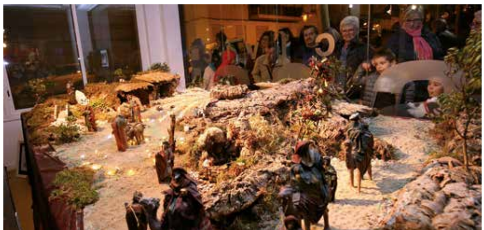
▲ El pessebre té una llarga tradició històrica que al Masnou s'ha preservat any rere any. RAMON BOADELLA

Tal com diu la dita popular, "De Nadal i de Sant Joan, només n'hi ha un cada any," i per a aquests dies tan especials l'agenda es farceix d'experiències per espremér-los al màxim