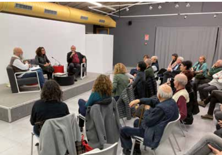
▲ El públic va escoltar amb interès la conversa. DOMÈNEC CANO

Més enllà de la persecució política, la conversa, que va durar poc més d'una hora, va estar farcida de referències literàries i periodístiques que ajuden a conèixer l'obra i el pensament de Fuster. ■