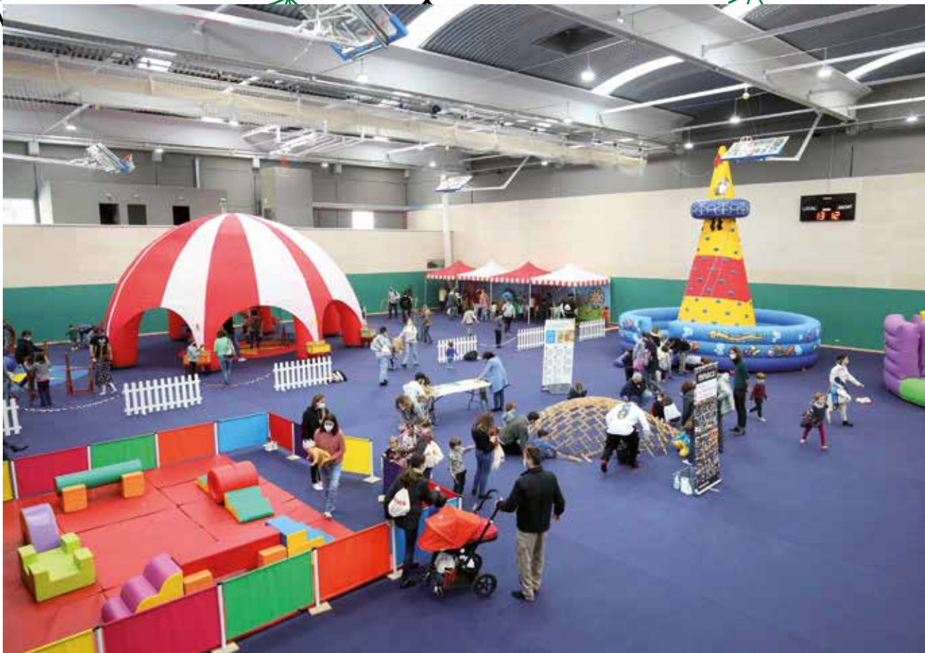
▲ El Nadalem convertirà el Complex Esportiu en un gran parc infantil de lleure i diversió. RAMON BOADELLA

Abans de l'arribada de Ses Majestats, perquè els nens i nenes gaudeixin al màxim de les festes de Nadal, s'oferiran propostes variades, com el Nadalem, que inclou activitats infantils per a diverses franges d'edat, entre els 0 i els 12 anys. Tornarà a instal·lar-se durant