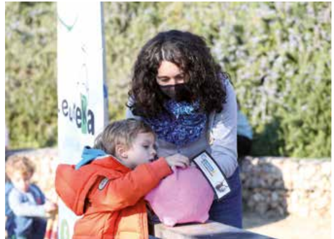
▲ El Nadal impulsa diferents iniciatives solidàries. RAMON BOADELLA

de TV3— són algunes de les iniciatives solidàries previstes per implicar la comunitat masnovina en una època de l'any en què la solidaritat s'accentua i adquireix una major rellevància.