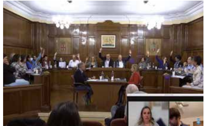
▲ Captura de pantalla de la retransmissió en directe de la sessió.

Al mateix Ple també es va aprovar l'inici de l'expedient d'establiment del servei públic municipal d'abastament d'aigua potable a domicili