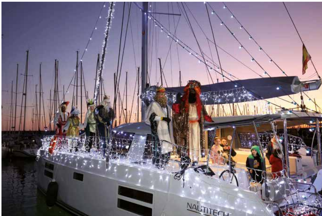
▲ El 5 de gener, Melchior, Gaspar i Baltasar desembarcaran al port esportiu a les 17.30 h. RAMON BOADELLA

Les propostes infantils faran d'aquestes festes uns dies per recordar