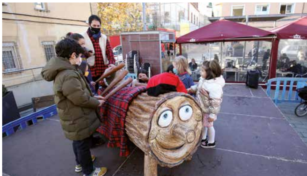
▲ Com mana la tradició, els infants fan cagar el tió donant-li cops de bastó. RAMON BOADELLA

El tronc amb barretina és un personatge de la mitologia catalana i és una de les tradicions més arrelades per aquestes festes