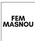
Grup Municipal de Fem Masnou

Arribat el mes de desembre i acabant l'any, és moment de fer balanç, de retre