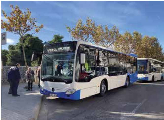
▲ El primer viatge del nou autobús va ser el 23 de novembre. DOMÈNEC CANO

El nou vehicle, que presta el servei de la línia C19, permetrà reduir les emissions de gasos contaminants i el consum de combustible