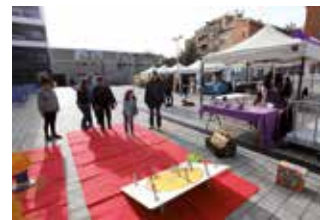
▲ RAMON BOADELLA

La plaça Nova de les Dones del Tèxtil va acollir, el diumenge 27 de novembre, la festa del Dia Internacional de les Persones amb Discapacitat per gaudir d'un bon nombre d'activitats i de la mostra d'entitats relacionades amb la temàtica.