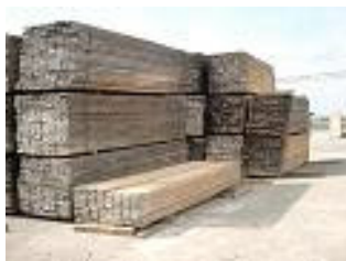
Això són taulons.