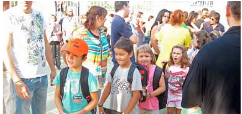
Escolars del Masnou tornant a les aules el mes de setembre passat.

Cal fer les preinscripcions dintre de termini per mostrar la demanda real de grups de P3