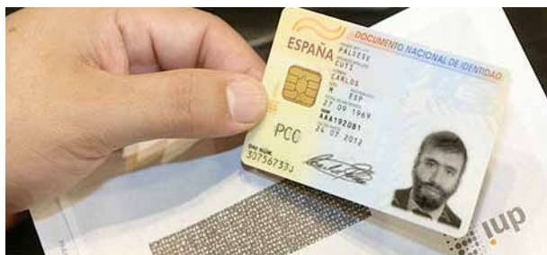
Cal demanar hora prèviament a l'OAC.

El dia 19 de març s'oferirà per primera vegada aquest servei al municipi per a les persones que hi han demanat hora prèviament. La renovació del DNI es farà a l'antic local de l'ONCE (també conegut com el Casinet, carrer de Barcelona, 5) de les 9 a les 13 hores i la recollida serà