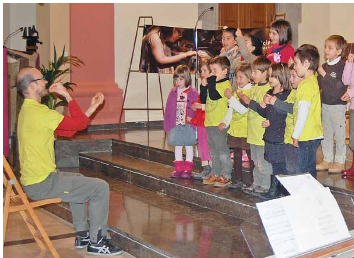
L'actuació dels alumnes de l'EMUMM va omplir de públic l'església de Sant Pere durant el concert d'hivern.

Ara per ara, l'EMUMM es consolida, a més, com una entitat activa en la vida social del municipi. El concert d'hivern, el dissabte 23 de febrer, a l'església de Sant Pere, va aconseguir escalfar la temperatura d'un matí que havia començat amb una imatge del Masnou emblanquinat per la neu. Els diferents grups de l'escola van interpretar diverses peces, algunes amb reminiscències tropicals i caribenyes, que van servir per mostrar els aven-