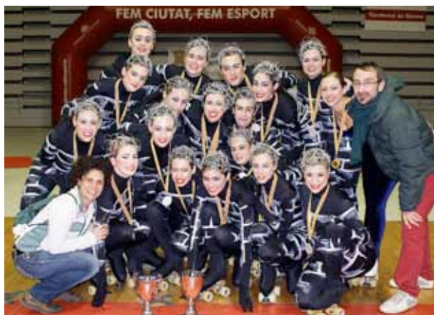
CP EL MASNOU

Durant el cap de setmana del 9 i 10 de març, es va celebrar a Reus el XII Campionat d'Espanya de Patinatge en la modalitat de xous, en què el CP El Masnou va aconseguir el tercer lloc. ■