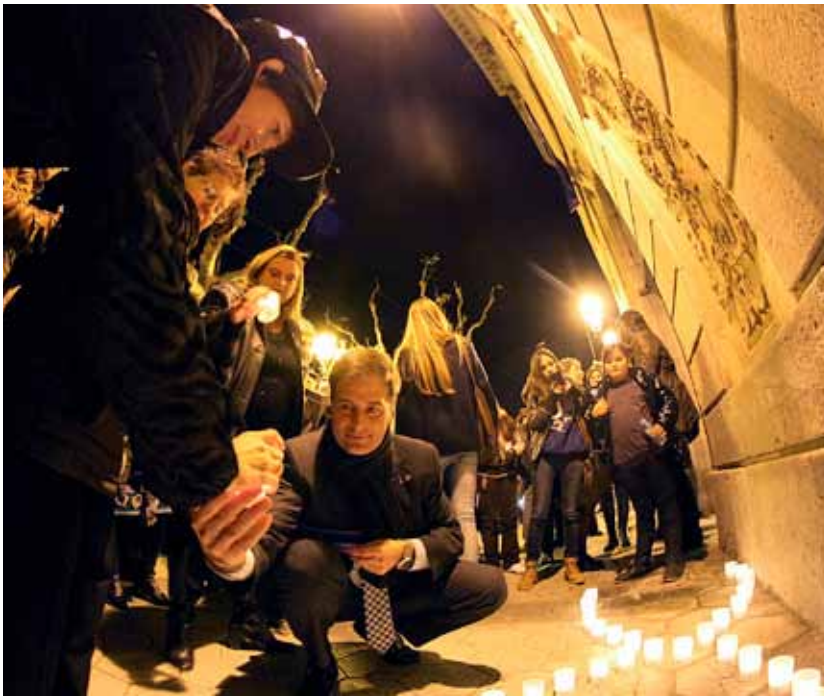
L'encesa d'espelmes està inclosa dins de l'acte central de la campanya.

Actes al voltant del Dia Internacional per a l'Eliminació de la Violència envers les Dones