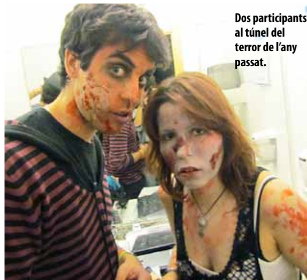
Dos participants al túnel del terror de l'any passat.

La Regidoria de Joventut, amb la col·laboració de diverses entitats, ha organitzat un seguit de propostes per a la celebració de la Castanyada Jove 2013. Els actes començaran el dia 30 d'octubre, a Ca n'Humet, amb un taller de decoració típica de Halloween, que anirà seguit d'un altre de maquillatge de terror, el dia 31. Aquestes sessions volen servir com a antesa- la i com a preparació del túnel del terror, que es durà a terme el divendres 1 (de 19 a 22 h) i el dissabte 2 (de 21 a 0 h) de novembre. L'Associació Juvenil de Teatre (AJTEM) col·labora en aquesta activitat, que vol assegurar bones dosis de terror