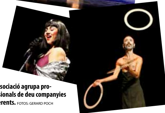
L'Associació agrupa professionals de deu companyies diferents.

la manera de fer del col·lectiu i els seus projectes de futur tenen moltes possibilitats de desenvolupar-se gràcies a la tradició del Ple de Riure i per la presència d'una població instruïda, sensible i propera als valors del circ contemporani i de la cultura en general.