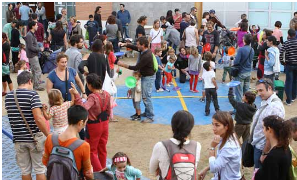
La presentació del LACAM va crear una gran expectació i molta participació.

Els dies 23, 24, 27 i 28 de desembre, el LACAM farà un taller de circ per a infants a l'Espai Escènic Ca n'Humet. Allà, els participants podran fer un tast de malabarismes, acrobàcies, jocs d'expressió i ritme. L'activitat s'adreçarà a infants a partir dels 5 anys. A més a més, els bons resultats de la tarda de circ del 13 d'octubre han empès el LACAM a organitzar una nova actuació per al mes de gener. Ara per ara, es troba en un moment incipient, però avancen que els agradaria mostrar alguns dels números que ja formen part del repertori d'alguna de les deu companyies de les quals formen part els membres del col·lectiu. A més a més, com ja va passar a l'actuació anterior, volen implicar totes les persones amb qui ja interactua el col·lectiu. Tothom té alguna cosa a oferir-los: aquesta és una de les claus de la manera d'actuar del col·lectiu. Perquè quan tothom ofereix alguna cosa, sempre s'hi surt guanyant. Qui no ha volgut viure sempre envoltat de l'atmosfera màgica i sorprenent del circ? Ara, la població del Masnou en té l'oportunitat.