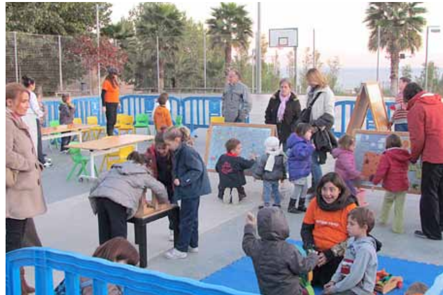
Una de les activitats per reivindicar els drets dels infants l'any passat.

E l mes de novembre comença, per als més petits, amb una festa ben engrescadora, que portarà la visita d'un personatge ben especial i emblemàtic d'aquesta època de l'any: la Maria la Castanyera. Serà a l'Espai Familiar "Ludoteca" l'1 de novembre, a partir de les 17.30 h, i permetrà conèixer totes les tradicions pròpies de la