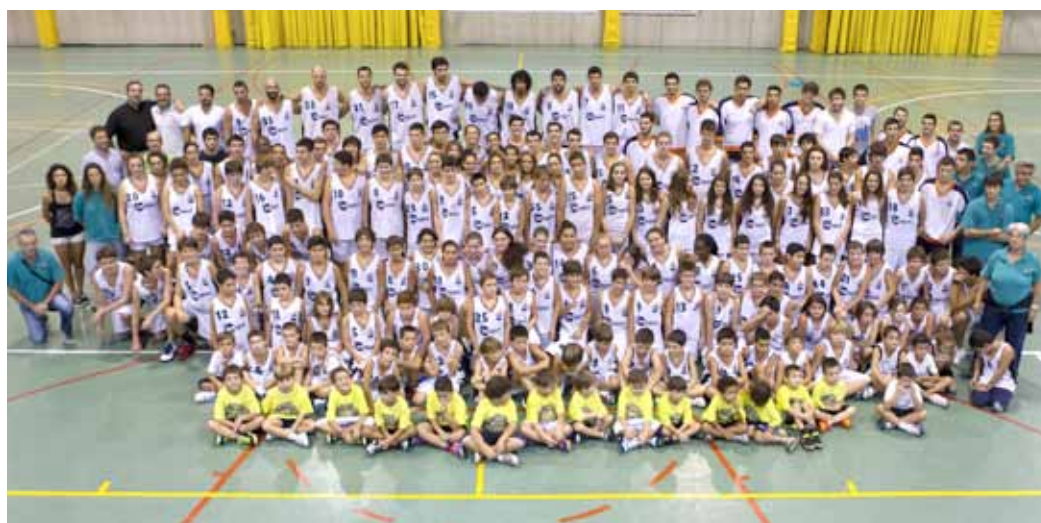
A la imatge, la foto feta durant la presentació dels equips del Club.