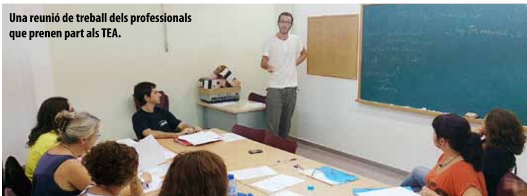
Una reunió de treball dels professionals que prenen part als TEA.

Al voltant de 120 alumnes gaudeixen d'un servei que vetlla perquè adquireixin bons hàbits de treball