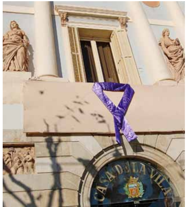
El 25 de novembre, l'Ajuntament tornarà a penjar el llaç lila.