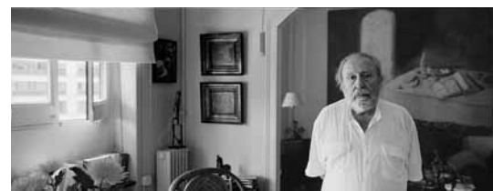
Algunes de les fotografies de directors, d'Óscar Orengo, que es podran veure al Casinet.