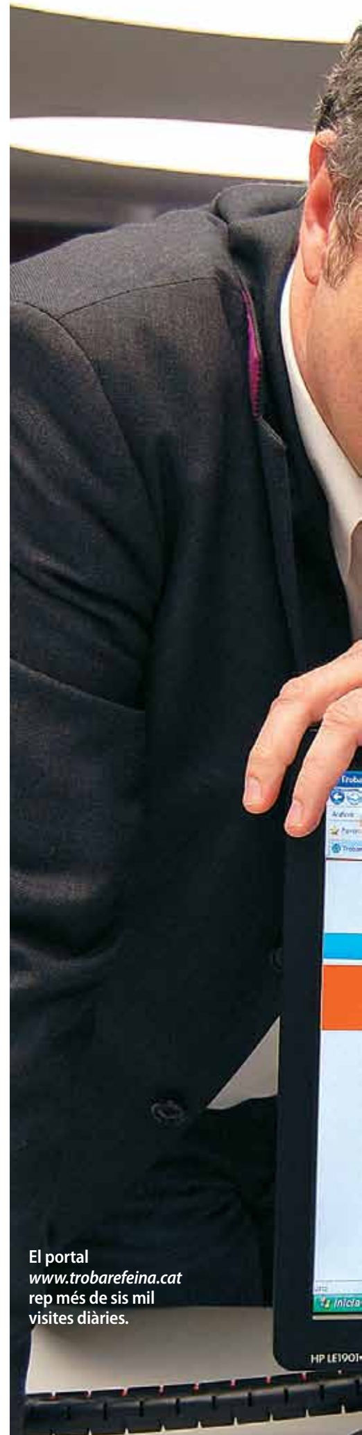
El portal www.trobarefeina.cat rep més de sis mil visites diàries.

A diferència d'altres portals, intentava que la informació fos immediata i dinàmica, que s'anés movent, que cada oferta de feina fos com una notícia. Volia que la gent mirés l'oferta de feina, hi accedís i hi hagués unes dades de contacte directe, sense cap més tràmit: que no calgués registrar-se ni enviar el currículum, sinó només contactar amb l'empresa.