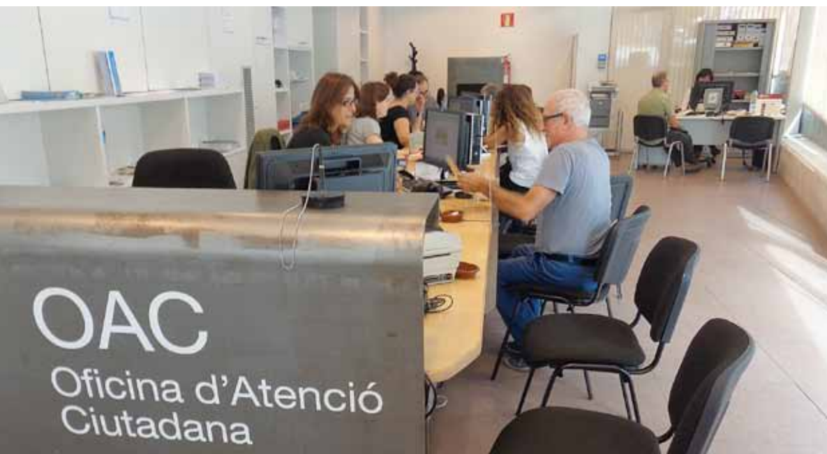
Alguns dels tràmits que es fan a l'OAC ja es poden gestionar des de casa.

Més oberta i accessible les vint-i-quatre hores del dia els set dies de la setmana