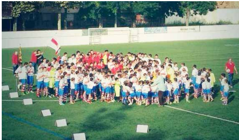
Els esportistes del planter, la promesa de futur del club.

El primer equip es presenta a l'afició amb un triomf sobre el Vilafranca