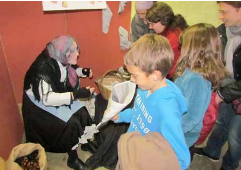
La Maria la Castanyera tornarà a l'Espai Familiar "Ludoteca" l'1 de novembre.

Teatre familiar, tallers i jocs per la igualtat centren els actes de l'agenda d'actes bimensual infantil