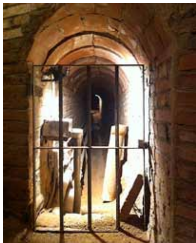
Una imatge de la Mina Museu.

Per gaudir de la visita al tram de la Mina i al safareig d'una casa particular, cal fer inscripció prèvia al Museu de Nàutica del Masnou ( museu.nautica@elmasnou.cat o tel. 93 557 18 30). ■