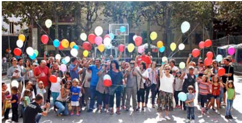
Moment de l'enlairada de globus amb desitjos.

E l bon temps del diumenge 6 d'octubre al matí va permetre que ESQUIMA omplís d'activitats el pati del Casino amb motiu de la seva 17a Diada de la Salut Mental. Tot i que la pluja de la tarda va obligar a cancel·lar alguns dels actes previstos, sí que es van poder fer els més tradicionals, com els tallers infantils, la tómbola de regals, la cercavila de la Colla de Diables del Masnou o l'enlairada de globus amb desitjos, a la qual van assistir un bon nombre de vilatans i vilatanes, entre els quals hi havia diverses autoritats municipals.