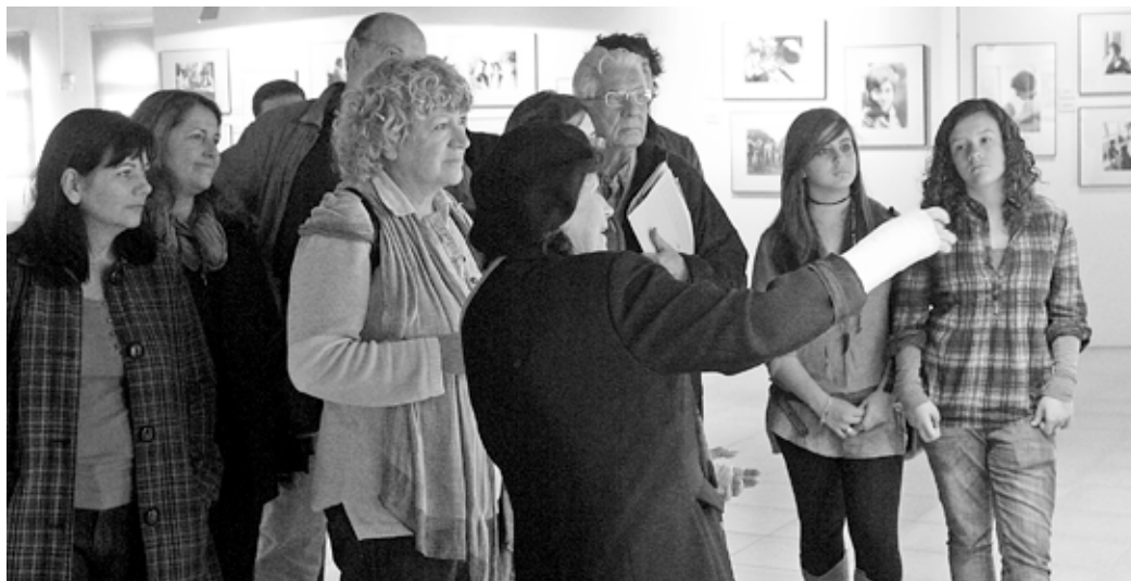
La FEM vol promoure l'art fotogràfic entre els seus adeptes, a més de potenciar l'aprenentatge i la creativitat.

El proper 1 de novembre, s'inauguren les V Jornades de Fotografia Creativa, una iniciativa que vol esdevenir un aparador de la producció de fotògrafs destacats (en les seves cinc edicions s'han fet exposicions d'obres de creadors de la talla de Pilar Aymerich, Agustí Centelles, Carles Fontserè o Luis Buñuel) per a la població en general, però, a més, vol promoure la formació i l'especialització en les diverses tècniques d'una disciplina que, amb la introducció de les novetats tecnològiques, es troba en redefinició constant.