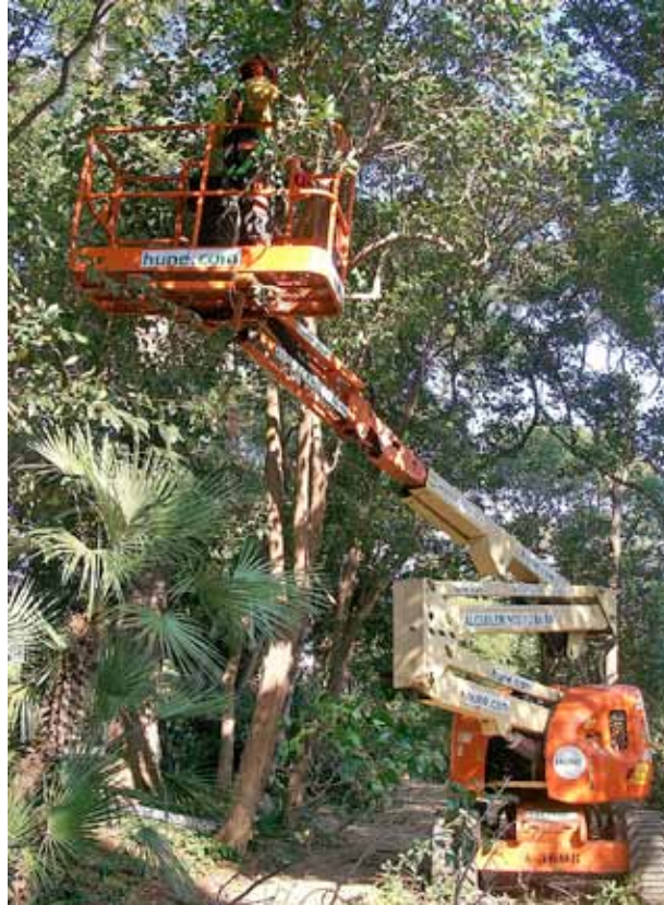
S'esporgaran gairebé cinc mil arbres.

Per a l'organització de la campanya d'esporga d'aquest any, s'ha dividit el poble per zones i se