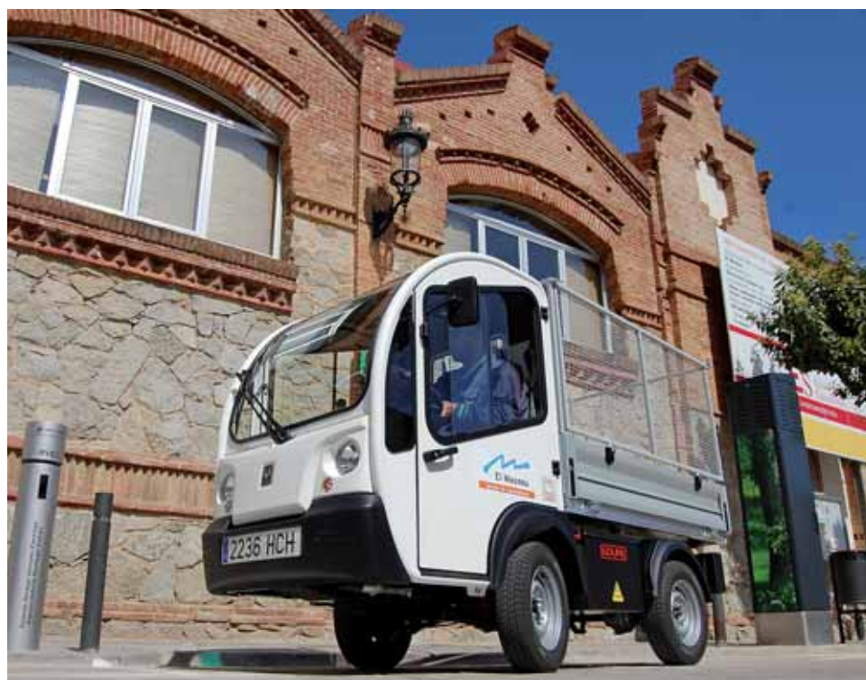
Vehicle elèctric de l'Ajuntament.