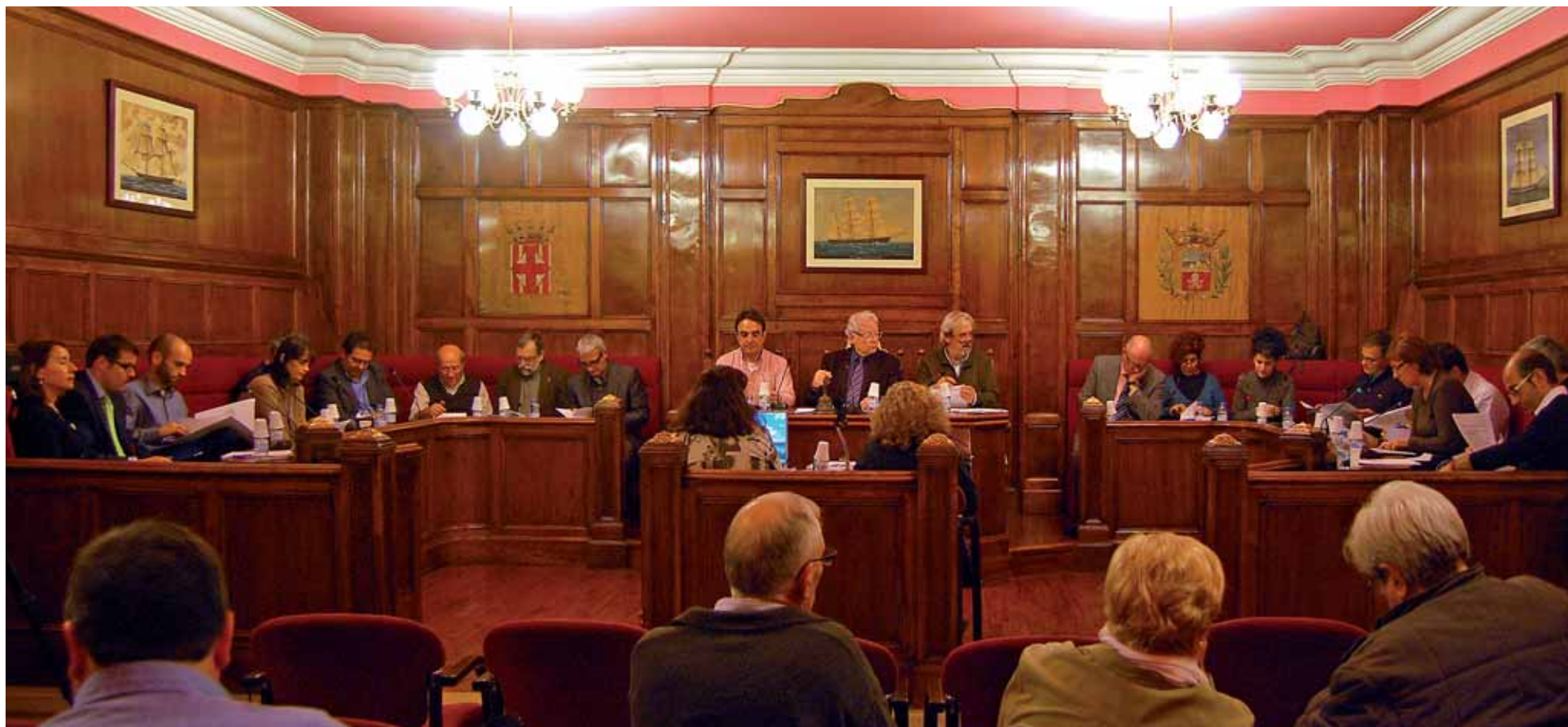
Ple del mes de març.