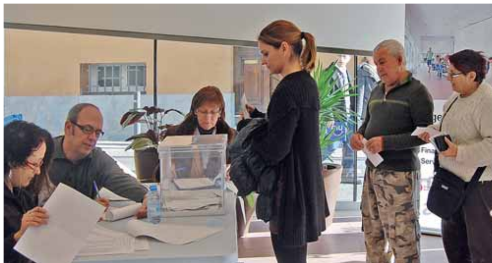
Les eleccions anteriors al Masnou van ser les autonòmiques, el 28 de novembre de 2010.