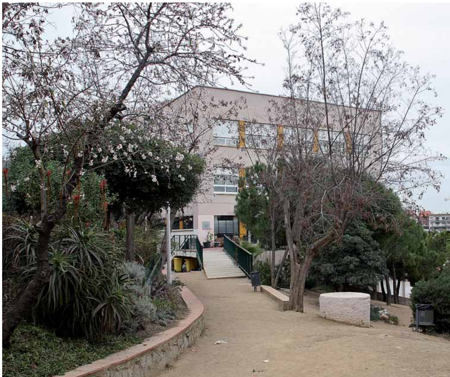
L'Institut Maremar està envoltat de vegetació, que és un dels atractius del centre.

És potser l'entorn fantàstic que envolta l'Institut Maremar el que fa que pugui semblar que l'institut es manté una mica aïllat. Encara hi ha qui pensa que és el albergue –de quan hi havia la Sección Femenina– i també queden alguns prejudicis sobre els antics centres de formació professional. Però la realitat és que l'alumnat d'aquest centre aconsegueix molt bons resultats a les PAAU (proves d'accés a la universitat) i té exalumnes cursant tota mena d'estudis universitaris amb èxit.