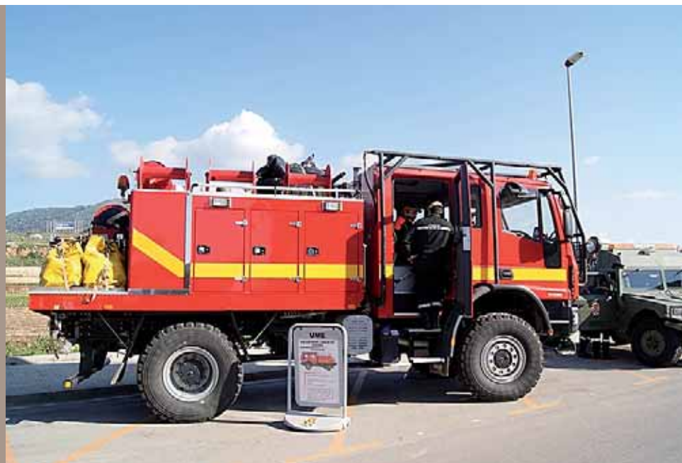
Un dels camions de bombers presents a la Trobada.

S'hi van poder veure vehicles policials, de bombers, de protecció civil o ambulàncies, entre d'altres. ■