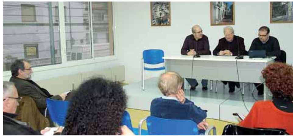
El 12 de març es van fer públiques les primeres conclusions de l'anàlisi del teixit associatiu.

La diagnosi apunta els reptes que caldrà afrontar en el moment de l'elaboració del Pla de participació, en vessants com l'organització de la participació, els processos i les experiències concrets, el fun-