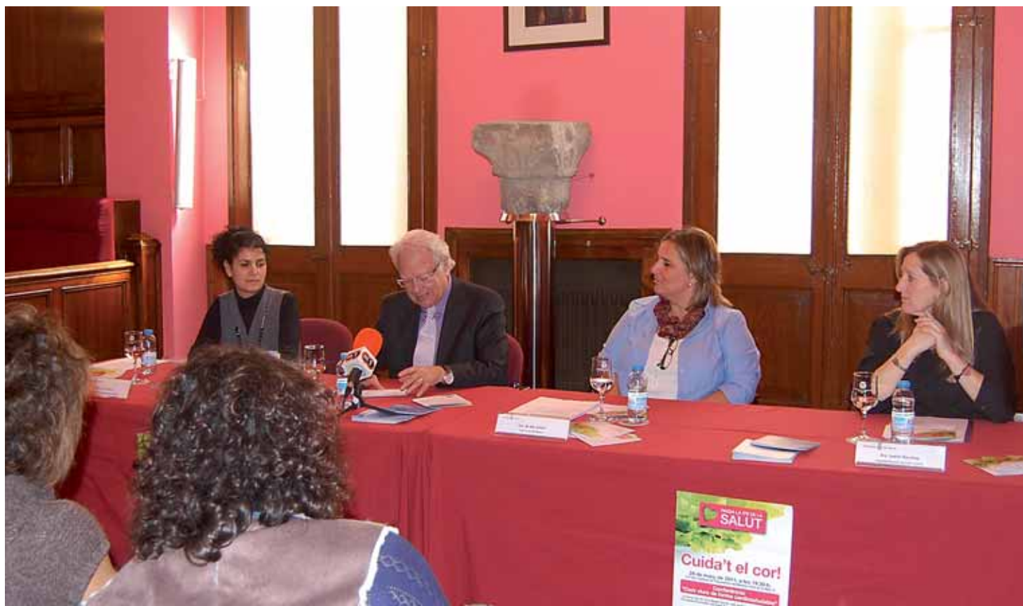
La campanya "Passa la ITV de la salut" es va presentar el 22 de març.

La ciutadania rebrà un llibret a casa amb informació sobre indicadors que marquen l'estat de salut i amb la recomanació d'acudir al CAP a controlar-se'ls de manera habitual