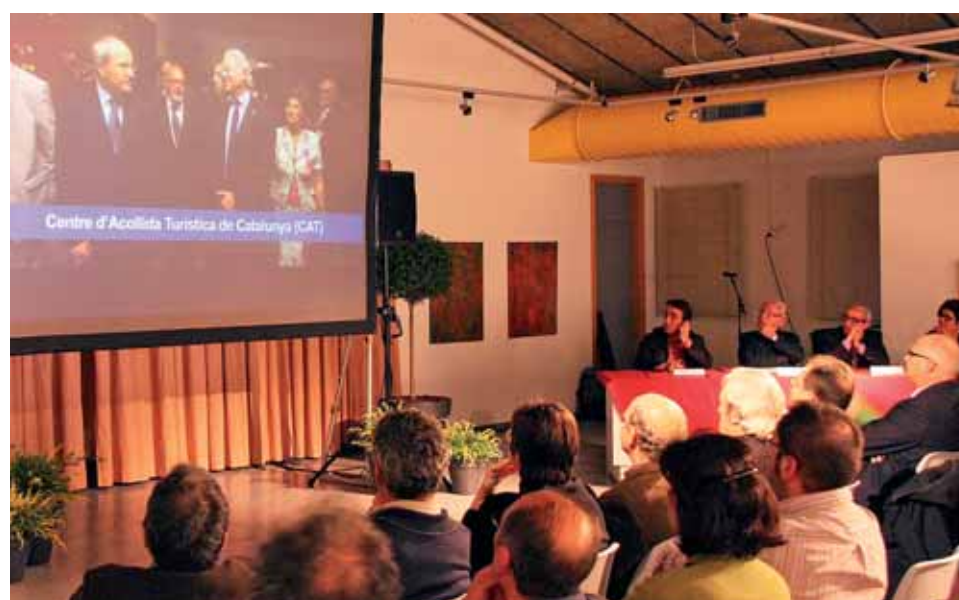
Un moment de la presentació del document.

L'acte es va acompanyar d'un vídeo explicatiu i, a la sortida, es va regalar un exemplar del document a totes les persones assistents. ■