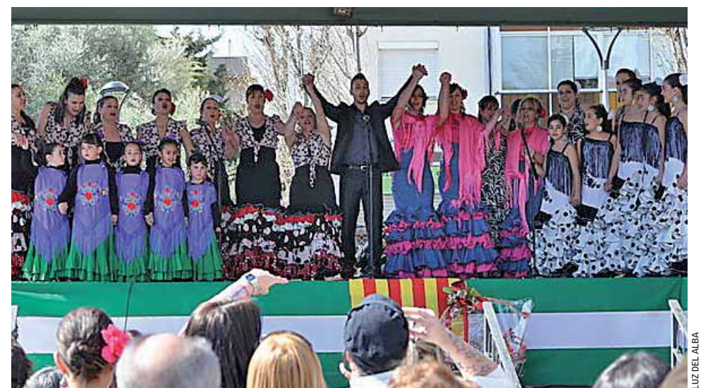
A la plaça de Ramón y Cajal es va celebrar una altra Dia d'Andalusia, organitzat per Luz del Alba.

També hi havia les típiques casetas . La trobada va ser organitzada per un grup de persones entusiasmades amb la seva terra i que compten amb la col·laboració per a la celebració d'aquesta diada de la Federació de Comerç i l'Ajuntament.