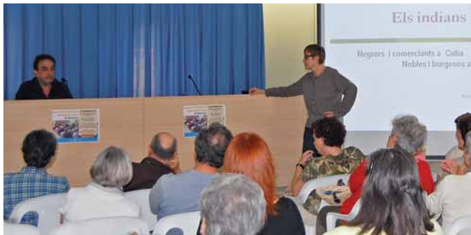
Una edició anterior de l'Aula d'Extensió Universitària.

El grup impulsor de l'Aula d'Extensió Universitària del Masnou està en la darrera fase dels treballs necessaris per a la posada en marxa d'aquest nou projecte educatiu. Els darrers mesos, un grup format per entre 15 i 20 persones interessades en aquest projecte s'ha trobat per tal de donar-li contingut.