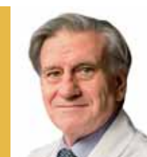
Valentí Fuster Cardiòleg