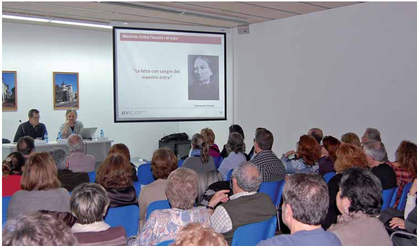
Moment de l'acte de reconeixement de la tasca educativa dels i les ensenyants del Masnou.

El municipi vol reconèixer la tasca dels i les professionals de l'ensenyament