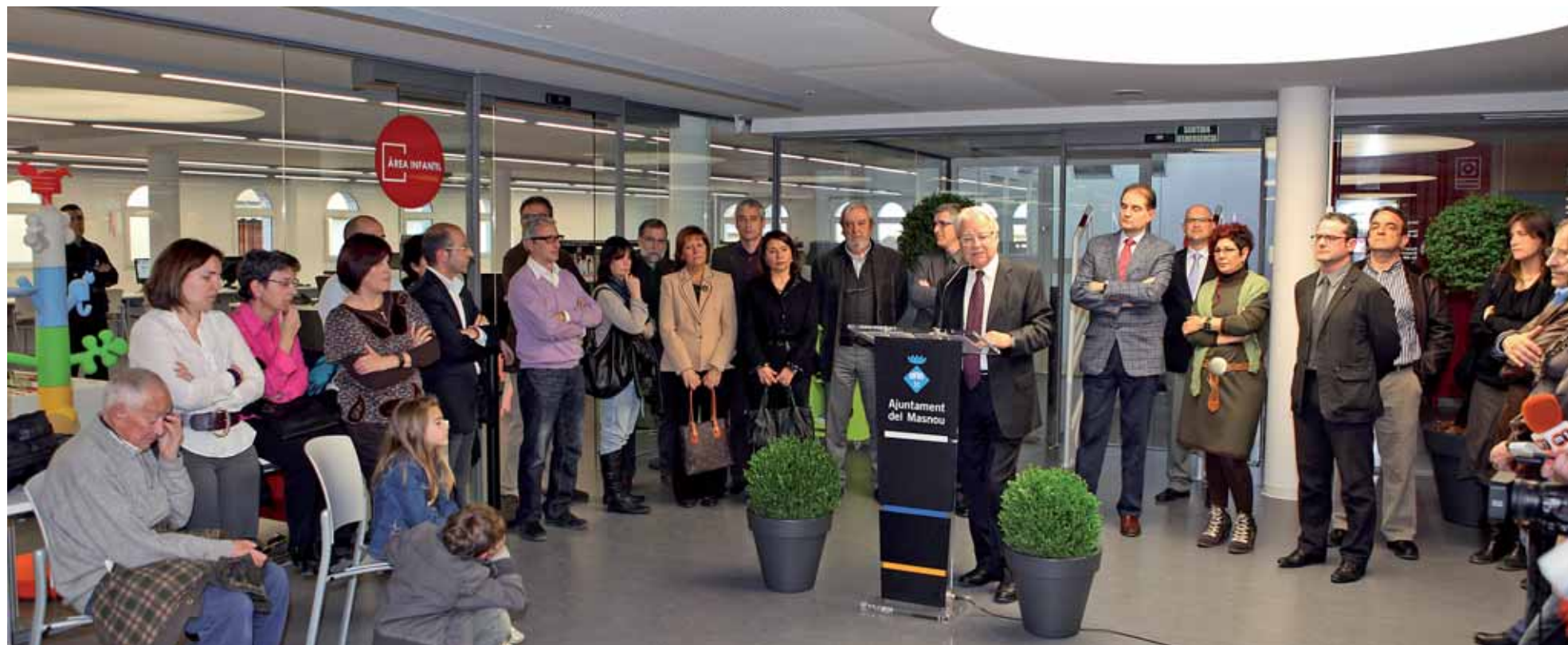
La inauguració de l'equipament ampliat va comptar amb l'assistència d'autoritats de la Generalitat, de la Diputació de Barcelona i de l'Ajuntament, i amb un bon nombre de masnovins i masnovines.