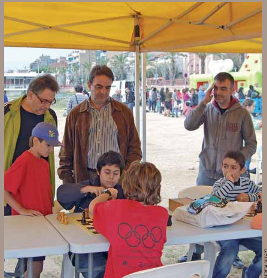
Les Miniolimpiades a la platja van ser una iniciativa del Consell Municipal d'Infants.

Un curs més, els centres de primària del Masnou col·laboren amb la Regidoria d'Educació per fer realitat el Consell Municipal dels Infants. Aquest projecte educatiu fa possible que els i les alumnes de 6è de primària rebin formació sobre els conceptes bàsics de la democràcia i la participació que, posteriorment, els permetran ser protagonistes d'un procés que finalitza amb la presentació d'una proposta al Govern municipal d'acord amb els seus interessos i les seves necessitats.