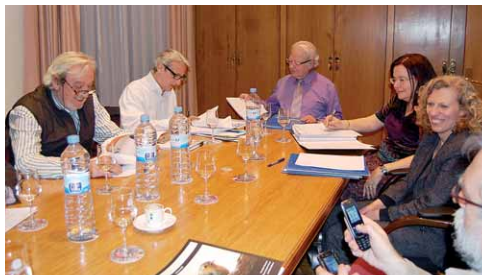
Una sessió de treball a la Junta de Govern Local.

aquesta pregunta m'ha fet reflexionar i m'he adonat que ja no podré anar prenent notes de les demandes que em feia la gent que em trobava al carrer. Intentaré ajudar, és clar, però ja no podré solucionar aquestes demandes.