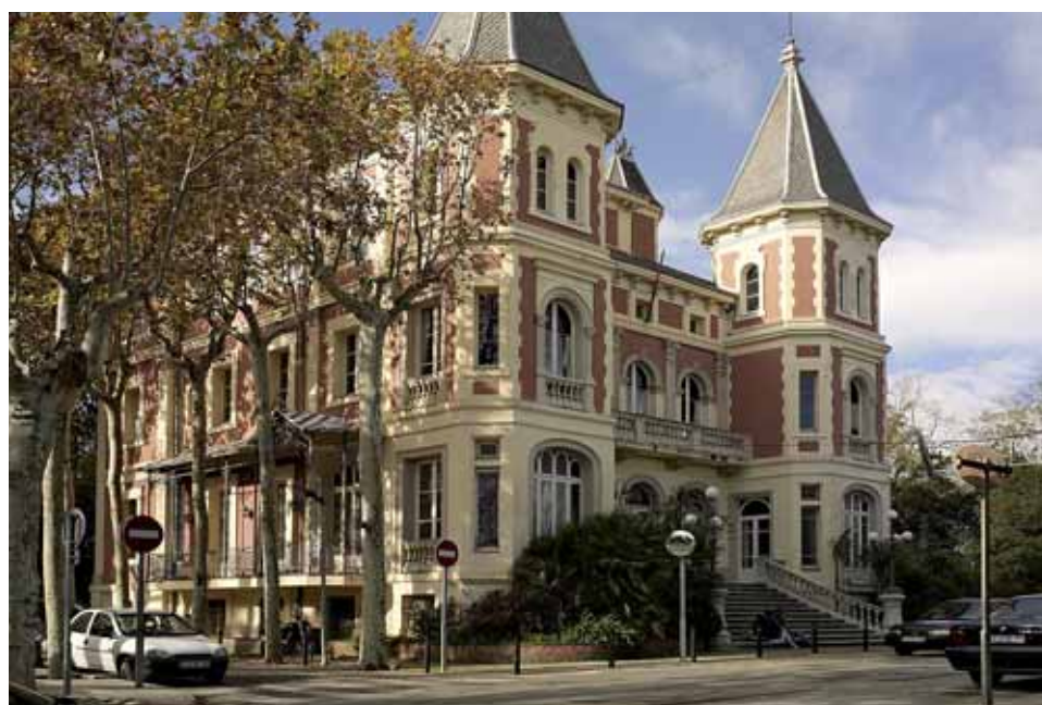
La Casa del Marquès està ubicada al barri de Bellreguard.