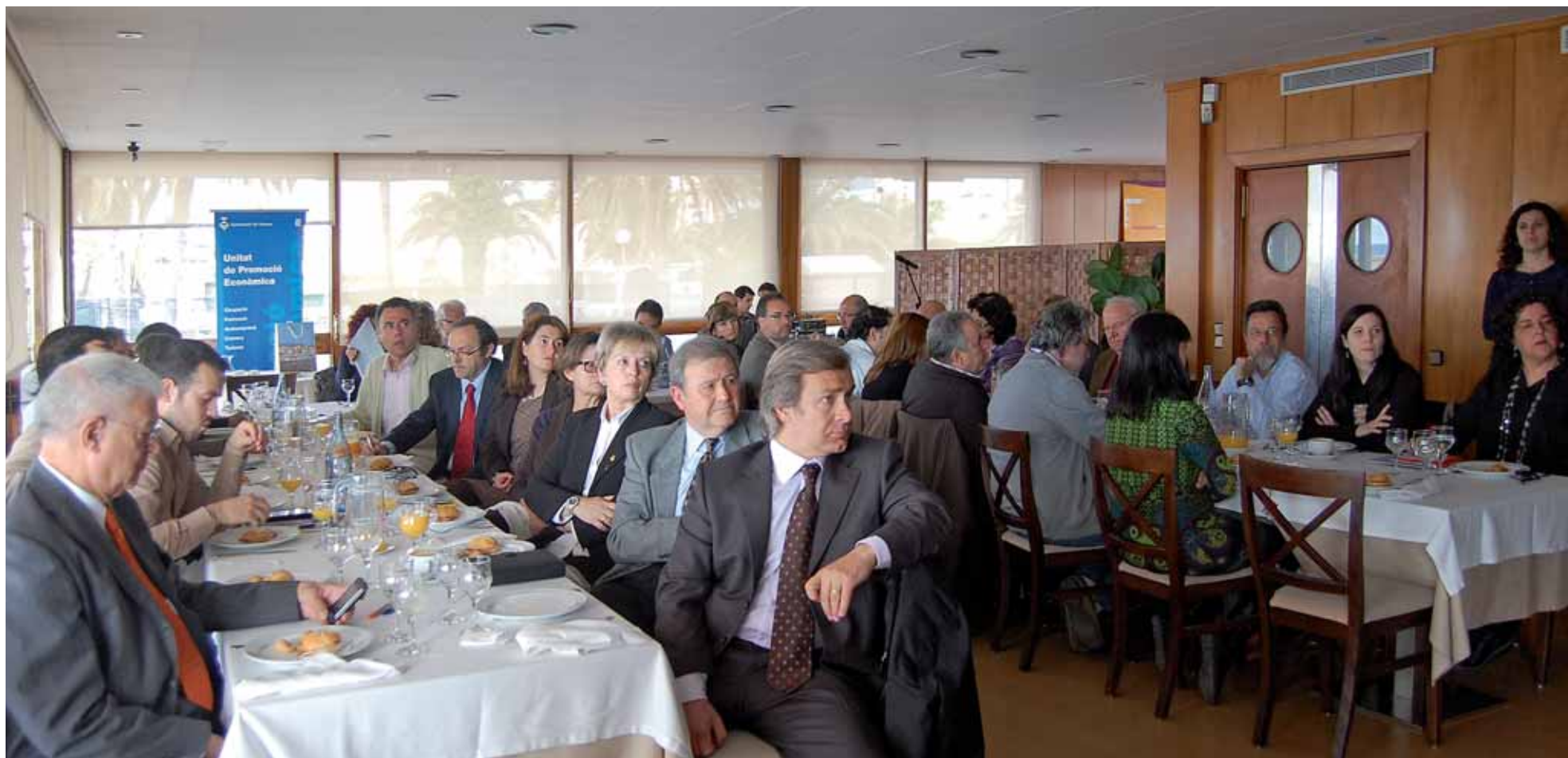
La darrera edició del Cafè i Empresa es va dedicar a la presentació del projecte del Centre d'Empreses i Negocis.

L'objectiu de la iniciativa és evitar que professionals i persones emprenedores que viuen al Masnou instal·lin la seva empresa fora del municipi