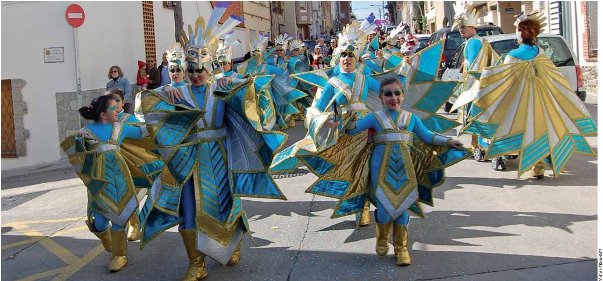
La rua de carnaval de les entitats, organitzada per la Comissió de Festes, va sortir del parc esportiu de Pau Casals i va arribar a la plaça de Marcel·lina de Monteyes.

La festa es va estendre amb activitats del 3 al 9 de març, organitzades per entitats i consistori