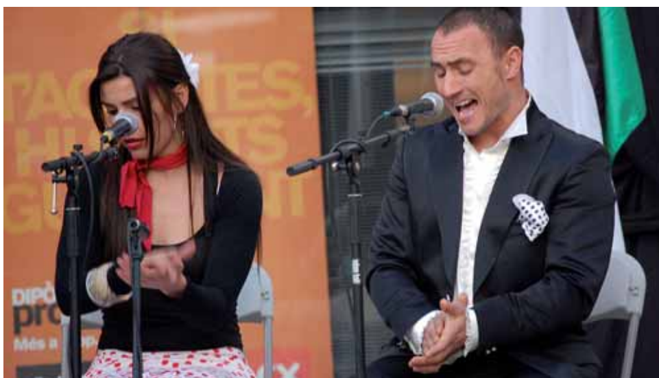
Una de les actuacions del dia de l'agermanament amb Andalusia i Extremadura.

Durant dos caps de setmana seguits, el municipi recorda i homenatja els costums folklòrics del sud d'Espanya