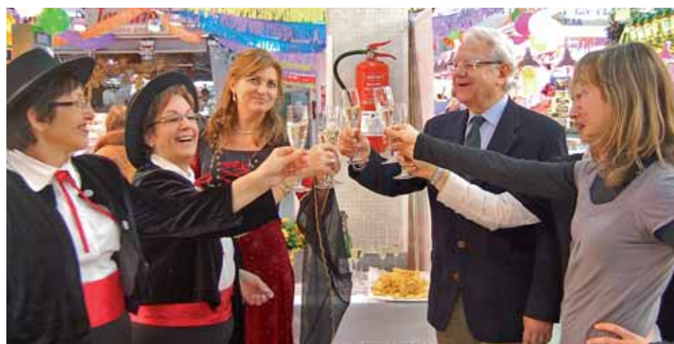
L'alcalde i els i les paradistes del Mercat van celebrar la posada en marxa de la targeta.

Des que es va posar en marxa el 24 de febrer passat, prop de dues mil persones ja han sol·licitat la targeta client del Mercat per gaudir de diferents obsequis. Amb cada compra, s'acumulen punts a la targeta client, que després es canviaran per vals de compra directa. Es pot adqui-