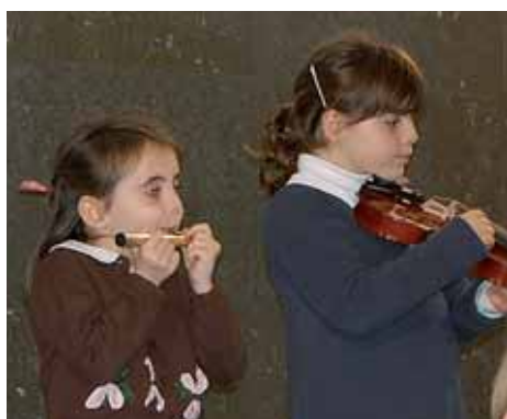
Actuació d'alumnes de l'EMUMM.

Durant el mes de maig es durà a terme el procés de preinscripció i matrícula de l'Escola Municipal de Música del Masnou. Primer, però, caldrà que el 26 d'abril es determini l'oferta de places. Després, el 5