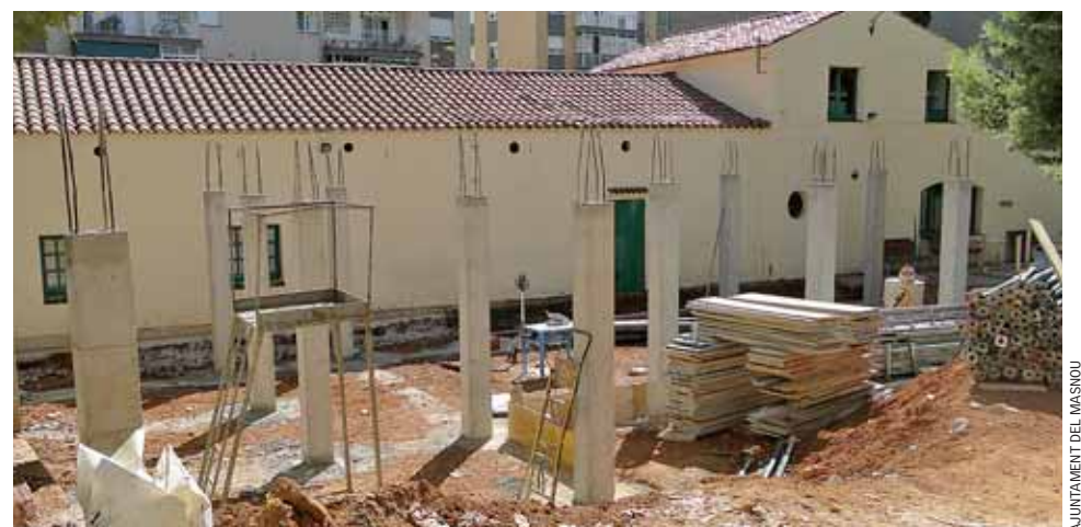
Les obres d'ampliació del Casal de Gent Gran de Can Mandri ja estan en marxa.

Segons les previsions, a principi d'octubre es reprendran les obres de millora dels accessos al CEIP Marinada i la instal·lació de marquesines de l'autobús urbà. Aquesta intervenció es va veure afectada pel concurs de creditors de l'empresa adjudicatària i això ha suposat un retard en les previsions. Mentrestant, s'han arranjat els accessos a l'escola i al Camp de Futbol d'Ocata per tal de causar les menors molèsties possibles al gran nombre d'usuaris i usuàries d'aquests dos equipaments. ■