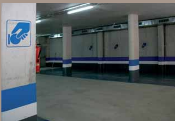
Interior de l'aparcament.

places i 13 de pupil·latge per a cotxes i 3 per a motos. De moment, l'Ajuntament està fixant les condicions del lloguer, que costarà 85 euros al mes en el cas dels automòbils i 30 per a les motocicletes. Per a més informació: Regidoria de Mobilitat. Tel. 93 557 17 00. ■