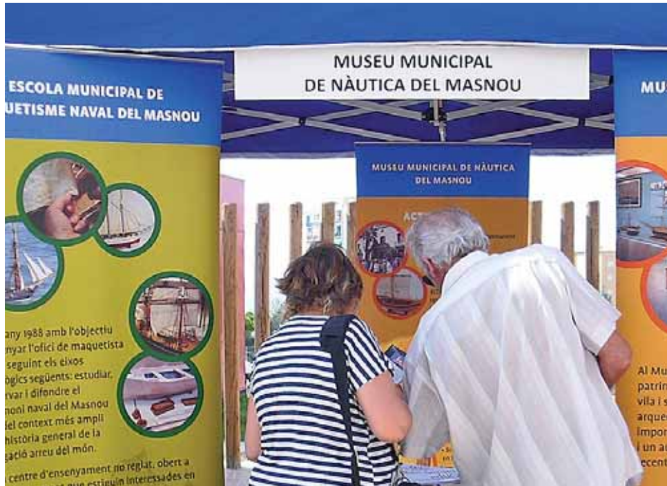
Punt d'informació de les activitats del Patronal Municipal del Masnou.