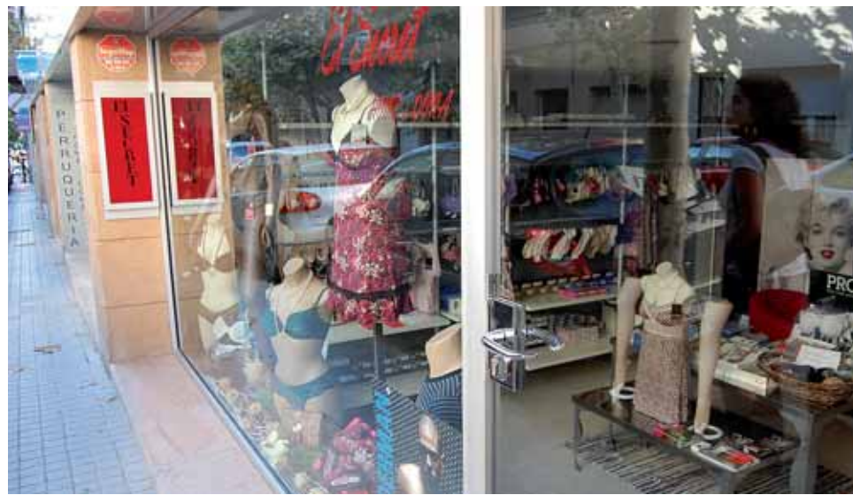
Una empresa creada a partir del programa d'assessorament.

ficar la viabilitat dels projectes que reuneixen les condicions necessàries. Al juliol del 2008, la Direcció General d'Economia Cooperativa i Creació d'Empreses va posar en marxa la xarxa INICIA, per a la creació d'empreses, i Promoció Econòmica del Masnou és una de les entitats d'assessorament participants.