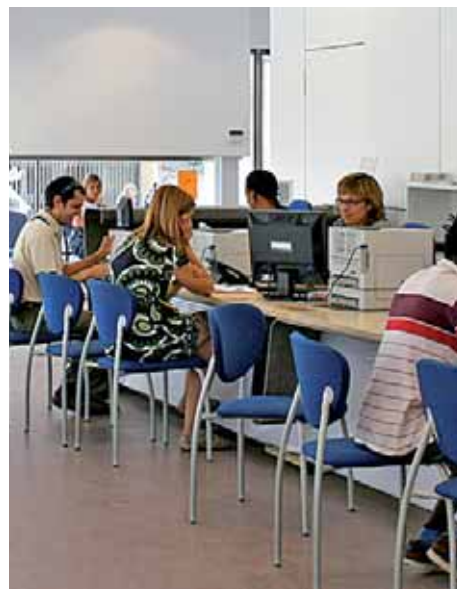
L'OAC, a ple rendiment.

El president de la Diputació de Barcelona, Antoni Fogué , va inaugurar, el 7 de juliol, el nou edifici de dependències municipals de Roger de Flor, 23. Fogué , acompanyat de l'alcalde i diverses autoritats locals, va visitar els carrers de l'entorn de l'equipament, que s'han reurbanitzat, i l'interior de les noves instal·lacions municipals. En el torn dels discursos, Fogué va remarcar que la tasca de la Diputació és donar suport als ajuntaments perquè continuïn avançant en el seu propòsit de donar el millor servei possible a la ciutadania.