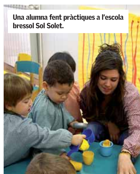
Una alumna fent pràctiques a l'escola bressol Sol Solet.