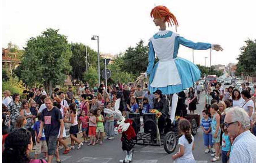
Una cercavila durant la Festa Major, que va aconseguir un gran nombre de seguidors.

i el Festival Internacional de Teatre Còmic Ple de Riure (del 20 al 24 de juliol). Totes tres iniciatives van aconseguir omplir de cultura, activitats i bon humor el municipi. Us n'oferim algunes imatges destacades. ■