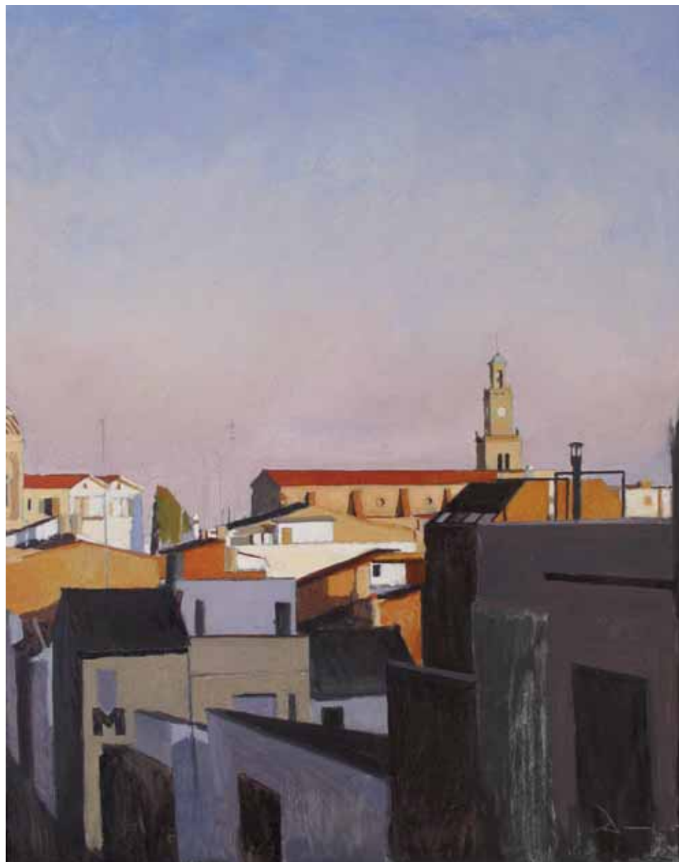
Obra 'Llum del Masnou', de Xavier Rodés.

D'altra banda, mentre duri la mostra s'ha previst un concurs entre totes les persones que hi assisteixin, que han d'intentar identificar i localitzar el màxim nombre possible dels espais reproduïts a les obres. Fins a l'11 de novembre, qui visiti l'exposició pot omplir una butlleta per participar-hi. Entre les butlletes que encertin més localitzacions se sortejarà una litografia numerada i signada per Rodés , que es lliurarà el 13 de novembre en un acte públic, que inclourà una visita comentada a la mostra a càrrec de l'artista. ■