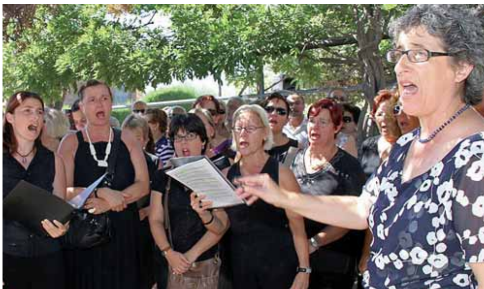
La Coral Xabec de Gent del Masnou va interpretar diverses peces amb motiu de la Diada.