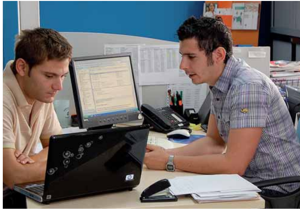
Un usuari del servei d'assessorament de creació d'empreses i autoocupació a la Unitat de Promoció Econòmica.

Un altre pas endavant en aquesta línia es va donar el 2007, quan l'Ajuntament va ser homologat com a Entitat Acreditada del Servei de Creació d'Empreses, amb la qual cosa, des de Promoció Econòmica, es podia certi-