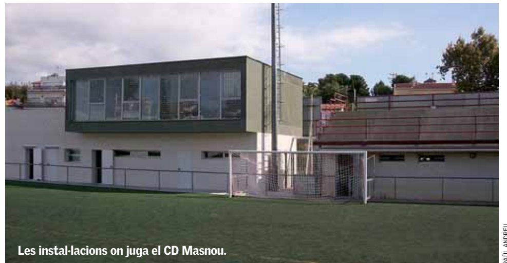
Les instal·lacions on juga el CD Masnou.

Aquesta actuació, que ha anat precedida de la construcció de nous vestidors i oficines per al club que utilitza les instal·lacions, el CD Masnou, es completarà amb l'enderroc dels antics vestidors i la renovació de les connexions i instal·lacions elèctriques de l'equipament. ■