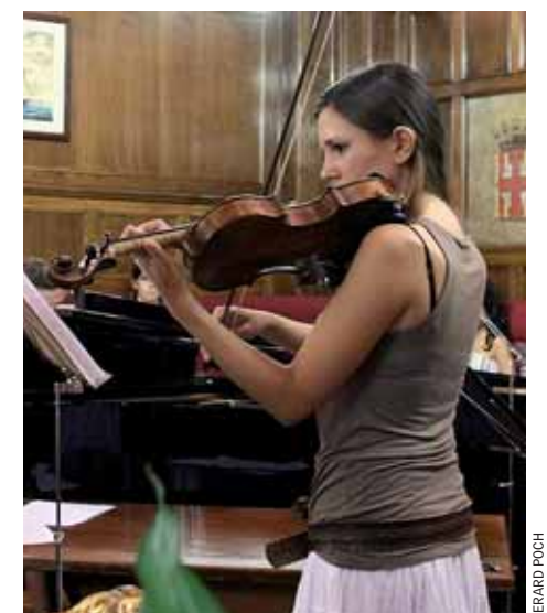
Una actuació del concert dels joves músics.