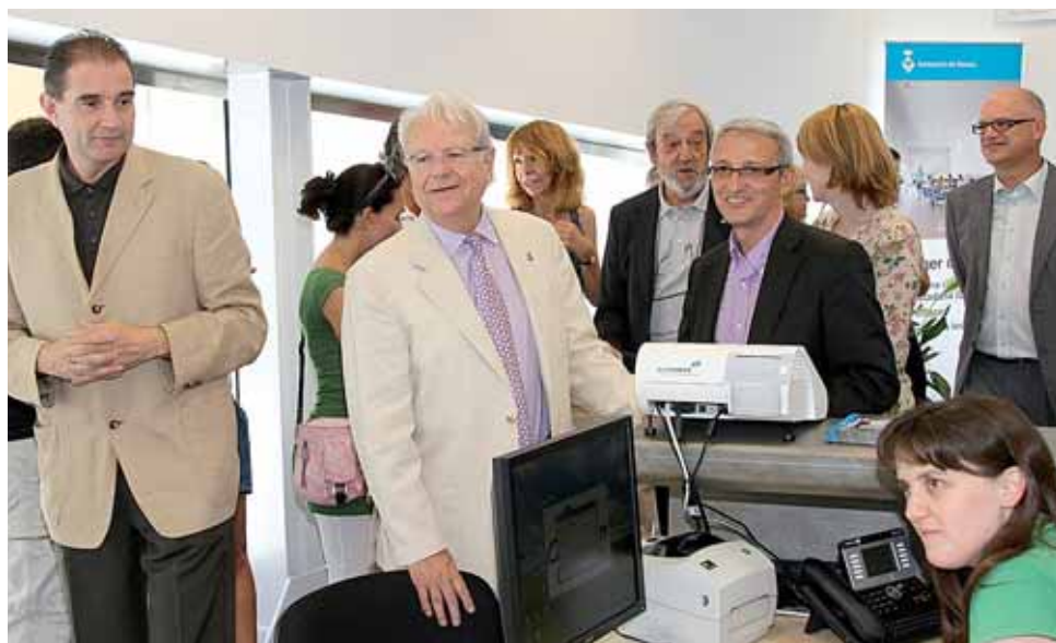
Moment de la visita del president de la Diputació al nou edifici municipal.

L'equipament acull l'Oficina d'Atenció Ciutadana (OAC), el Departament de Finances i tots els departaments que fan referència a l'Àrea de Serveis a les Persones