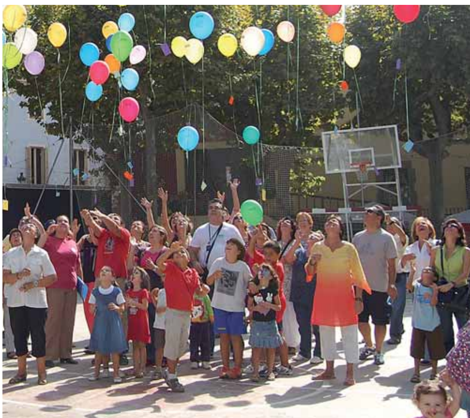
Un dels moments més emotius de la celebració d'ESQUIMA.

any s'intenta apropar el col·lectiu de persones amb malaltia mental a la població en general, per tal de trencar l'estigma que els acompanya. Aquesta activitat tindrà lloc en el marc de la Diada Mundial de la Salut Mental. La malaltia mental està acompanyada de malestar i l'entitat masnovina vol que aquesta activitat sigui un dia de gaudi, festa i color. ■