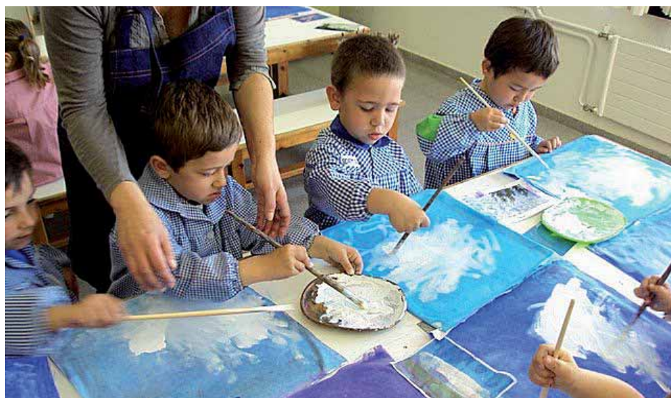
Un dels principis pedagògics del centre és crear un clima de participació.

Personalment, malgrat els temps difícils i força convulsos que estem vivint a les escoles i a la nostra societat en general, veig el futur immediat amb optimisme, ja que sé que, malgrat les dificultats, seguirem treballant per tirar endavant i anar-les superant, i per seguir aconseguint fer de la nostra escola un lloc agradable i inoblidable on aprendre a compartir, a llegir, a comprendre, a somriure, a ballar, a créixer, a fer amics i, en definitiva, a viure d'una manera plena.