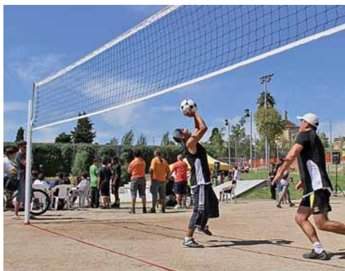
Jugadors de vòlei al nou espai.