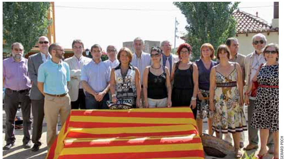
Membres del consistori del Masnou, durant la celebració de la Diada.