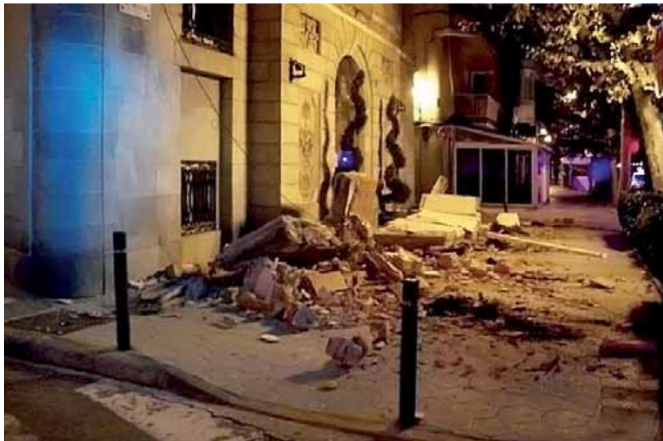
Estat del balcó moments després de la caiguda.

L'incident es va produir la matinada del diumenge 22 d'agost, raó per la qual no es van lamentar danys personals