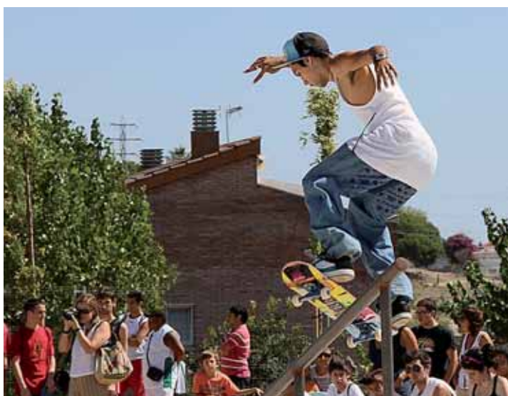
Un patinador estrenant la pista d' skate .

també va tenir un reconeixement per al col·lectiu de persones que han fet de la pista de voleibol un punt de trobada i d'integració social. ■