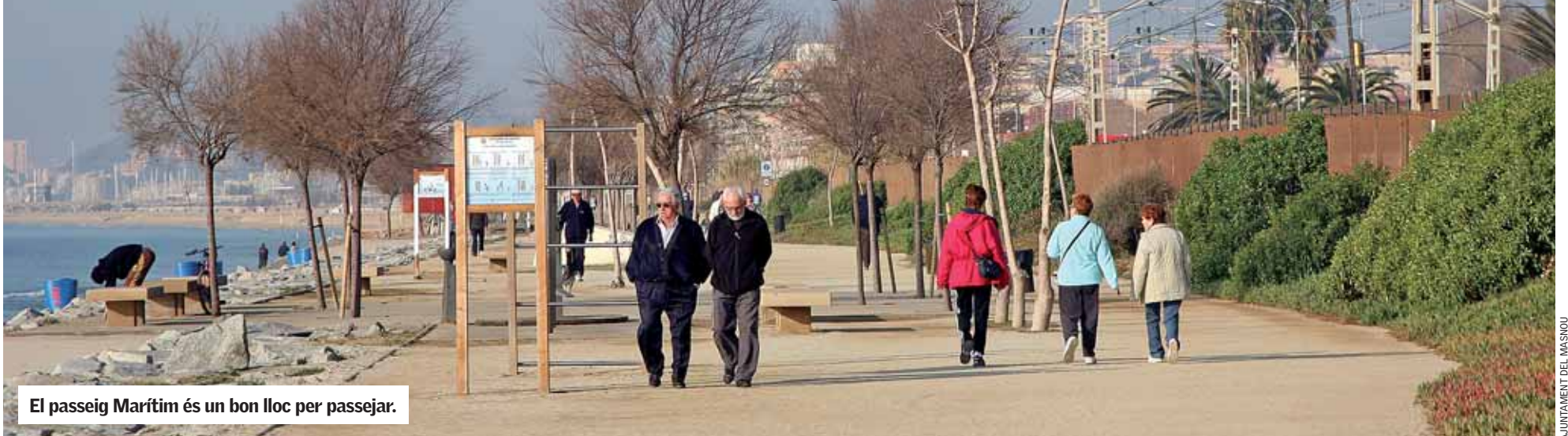
El passeig Marítim és un bon lloc per passejar.

“Mou-te amb el cap per viure millor”, el lema d'enguany