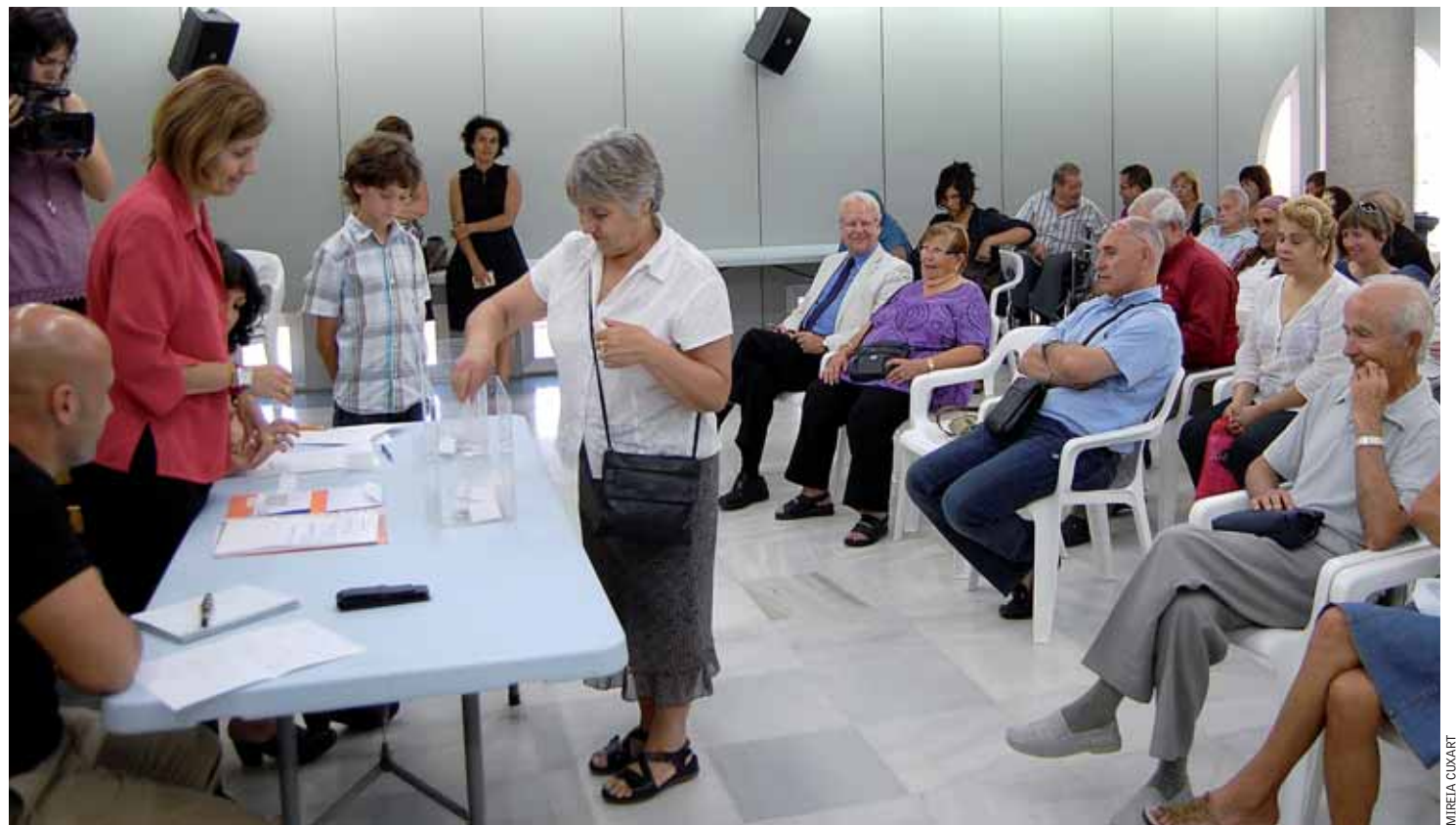
Una de les sol·licitants en el moment d'extreure la butlleta del sorteig dels pisos.

La signatura del contracte i el lliurament de les claus es porten a terme després que el 28 de juny passat, a Can Malet, es fes el sorteig dels pisos, a càrrec de l'empresa pública Adigsa, adscrita al Departament de Medi Ambient i Habitatge. Per accedir a un d'aquests pisos, es van admetre 38 sol·licituds i les 20 persones afortunades van poder visitar els seus futurs habitatges el mateix dia. Aquesta és la primera promoció d'habitatge per a gent gran que es fa al municipi. ■