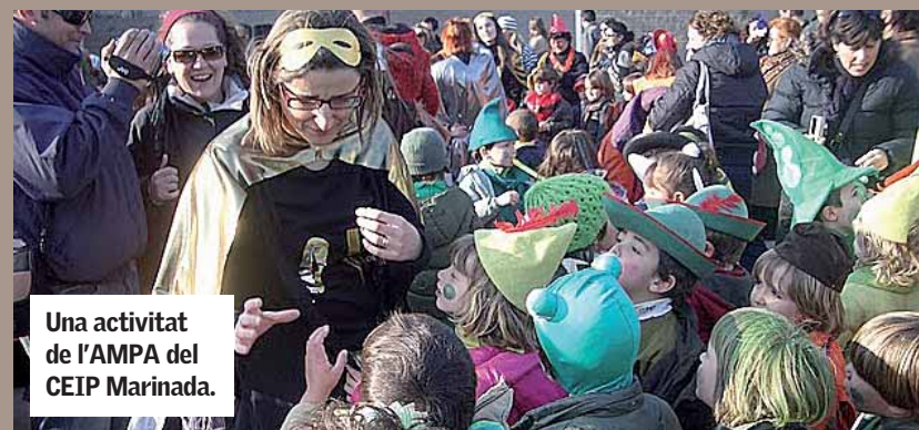
Una activitat de l'AMPA del CEIP Marinada.

D'altra banda, el consistori també ha rebut una subvenció per al foment de la participació de les activitats extraescolars, aquesta del Departament d'Educació de la Generalitat de Catalunya. ■