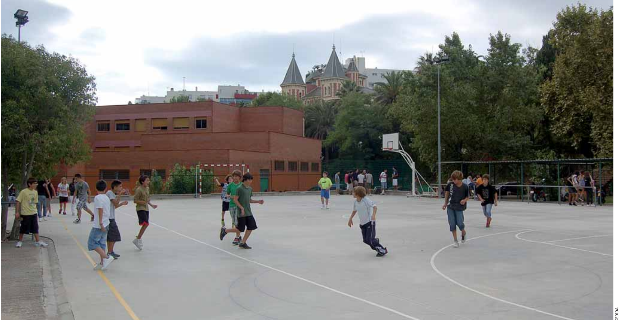
La iniciativa s'adreça a escolars que no poden acreditar l'ESO.