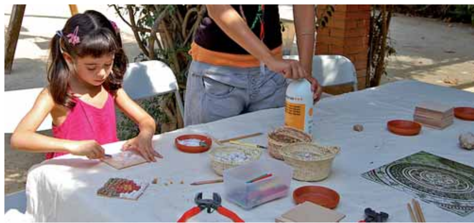
Un dels tallers didàctics per a infants.

El cap de setmana del 4 i 5 de setembre, es va celebrar la Festa de la Vinalia Rustica. Durant aquests dos dies, el Parc Arqueològic Cella Vinaria, gestionat conjuntament pels ajuntaments del Masnou, Alella i Teià, va oferir conferències, visites guiades teatralitzades i tallers didàctics per a infants. El Masnou es va unir a aquesta iniciativa amb tallers d'arqueologia i mosaic. Una vintena d'infants van gaudir d'aquests tallers, que van tenir lloc el dissabte 4 de setembre a Cal Ros de les Cabres, als jardins del Mil·lenari.