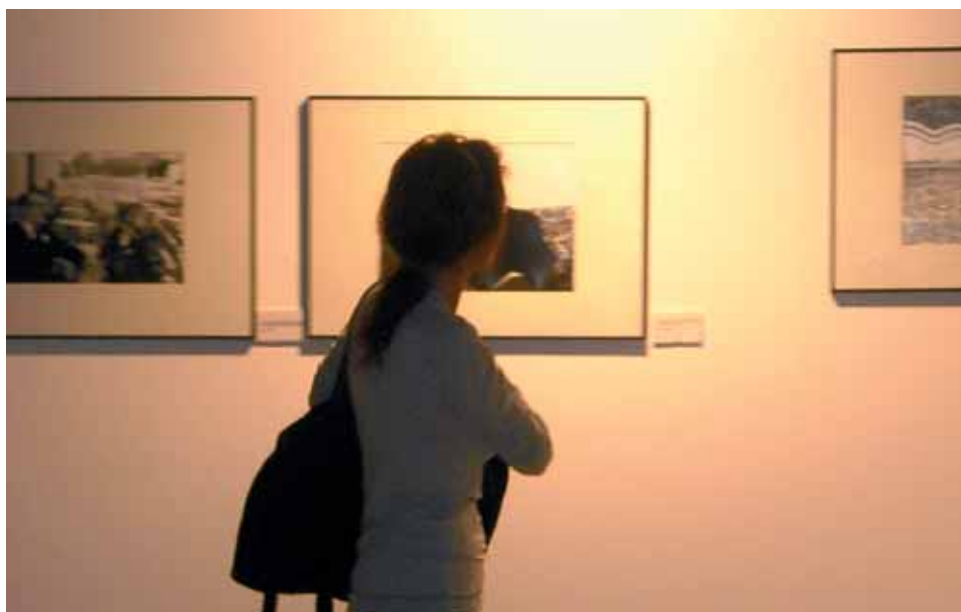
Les Jornades inclouen tot un seguit d'exposicions.

El programa s'obre amb una exposició del prestigiós fotògraf Agustí Centelles i una taula rodona sobre fotoperiodisme