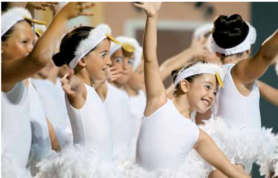
Les patinadores van tornar a mostrar la seva màgia.

La XXVI edició del Festival de Patinatge Artístic del Masnou, celebrada el 17 de juliol a les instal·lacions de l'IES Mediterrània, va aplegar més d'un miler de persones, que van omplir les grades i van gaudir dels diversos números que conformaven l'espectacle A què juguem?