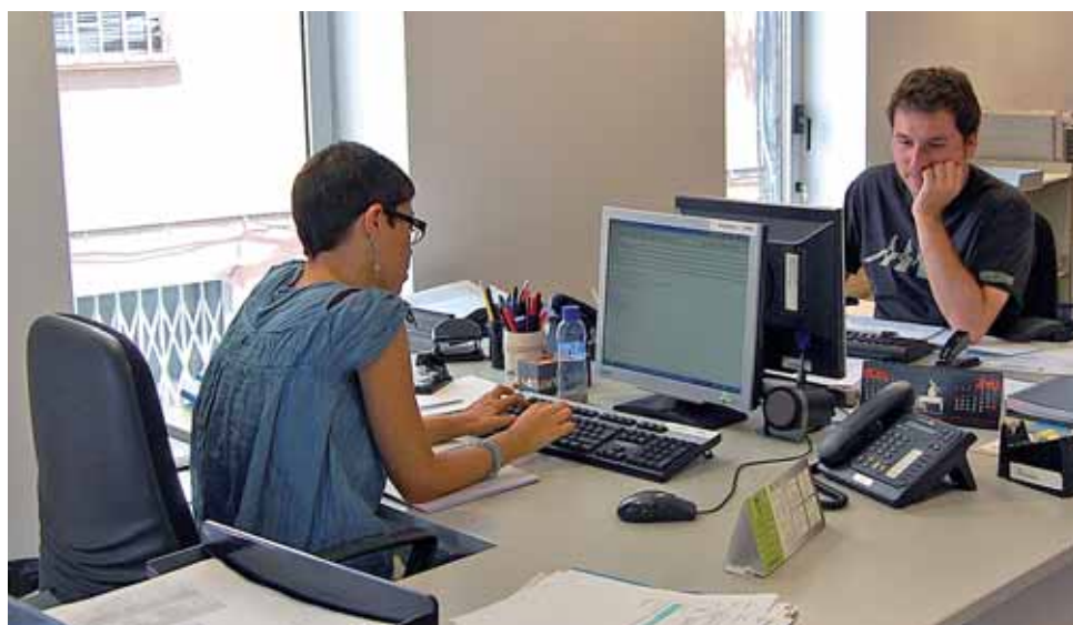
La Regidoria d'Educació es troba a l'edifici Roger de Flor, 23.

A partir de l'1 de setembre, la Regidoria d'Educació (i, en especial, l'Oficina Municipal d'Escolarització) ha fixat els dimecres com a dia d'atenció al públic. Aquest canvi respon a la voluntat de millorar l'organització interna. Les visites s'atendran, en horari de 9 a 14 h, al despatx 18 de