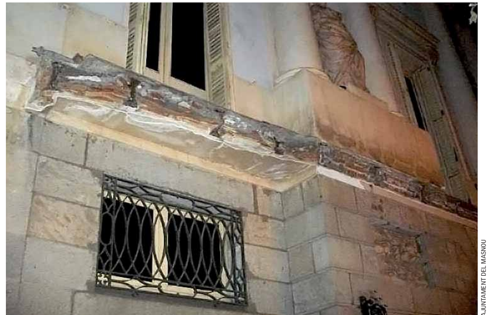
El balcó va ser afegit l'any 1958.

Tot i així, perquè aquestes conclusions puguin ser definitives, cal esperar l'anàlisi del formigó de les biguetes per determinar la composició del material i acabar d'aclarir si efectivament es tracta de ciment aluminós. L'estudi també recomana que conti-