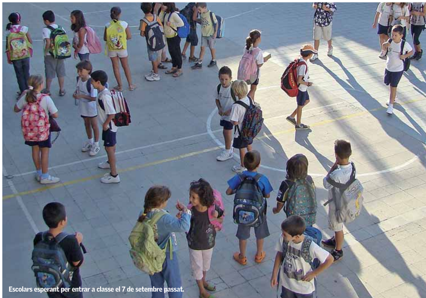
Escolars esperant per entrar a classe el 7 de setembre passat.

Per inaugurar el curs oficialment, el dilluns 20 de setembre, a les 18 h, tindrà lloc, a Ca n'Humet, l'acte d'inauguració del curs escolar 2010-2011. Per a aquesta ocasió, i atès que l'any 2011 és l'Any Internacional de la Química, s'ha programat una conferència que, amb el títol "La química i el plaer", pretén fer una repassada del que ha aportat la química al llarg de la història i també vol fer veure a la ciutadania que, com més coneixements es tenen de les coses que ens envolten, més satisfaccions s'obtenen. La conferència serà impartida per Víctor Nebot i Llombart , enginyer químic, llicenciat en farmàcia i en història de l'art i catedràtic de l'Institut de Física i Química. L'acte es clourà amb el concert que oferirà el duet format per Estel·la Broto (flauta) i Daniel Iglesias (violí), que interpretaran fragments de les òperes Les noces de Figaro , Don Giovanni i La flauta màgica . ■