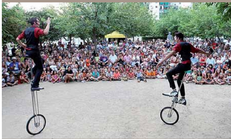
Les actuacions al carrer del Ple de Riure van resultar multitudinàries.