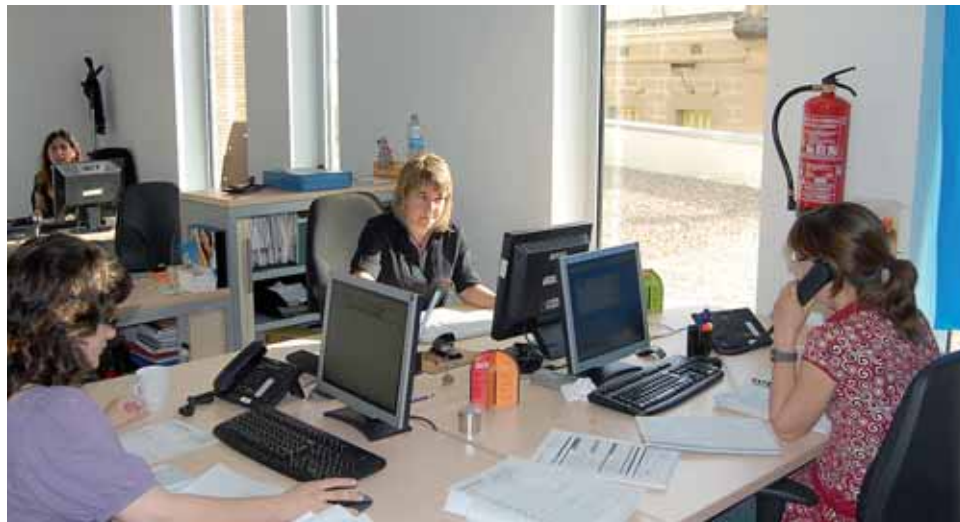
El Departament de Serveis Socials es troba a l'edifici Roger de Flor, 23.

destinat 59.060 euros a intentar paliar els problemes presentats per aquests expedients. Una bona part d'aquests diners s'ha adreçat a 46 ajuts per fer front a les despeses d'habitatge (26.126 euros), seguits pel suport a tractaments psicopedagògics, amb 34 casos (9.481 euros), i a les escoles bressol, 27 casos (9.344 euros). També són molt requerits els ajuts vinculats a activitats escolars (56 casos; 6.776 euros) i als subministraments de la llar (26 expedients; 4.000 euros). També s'han donat 11 ajuts per al transport adaptat (1.877 euros).