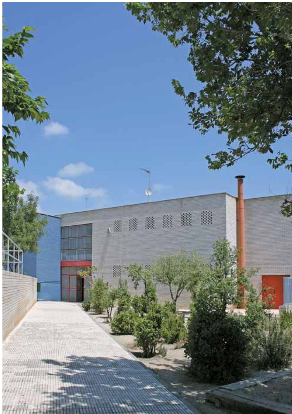
L'escola es troba a l'avinguda del President John F. Kennedy.

Com a activitats complementàries al currículum, el centre ofereix, també dins