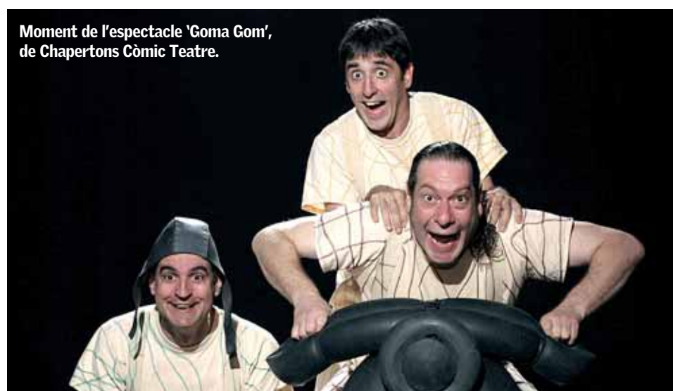
Moment de l'espectacle 'Goma Gom', de Chapertons Còmic Teatre.