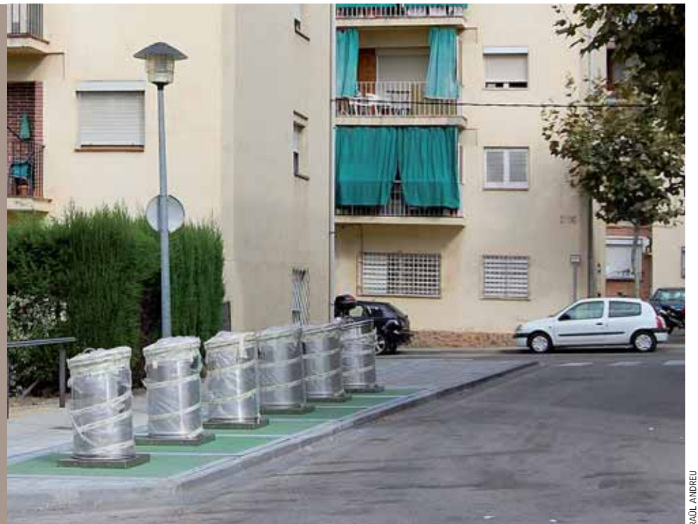
La nova unitat de contenidors del carrer d'Almeria entrarà aviat en funcionament, després d'una campanya informativa.

La instal·lació de les tres noves àrees de contenidors soterrats (al carrer d'Almeria i al passeig de Joan Carles I) ja ha finalitzat. Cada una està formada per sis grups que cobreixen les cinc fraccions de recollida selectiva. A partir d'ara, es comença una campanya informativa adreçada als veïns i veïnes i als comerços de les zones d'influència de les noves àrees d'aportació, i també es proporcionarà informació mediambiental a peu de carrer, que inclourà el lliurament d'un imant per a la nevera. Aquestes campanyes de comunicació s'iniciaran a l'octubre, a la vegada que entraran en funcionament les noves unitats.