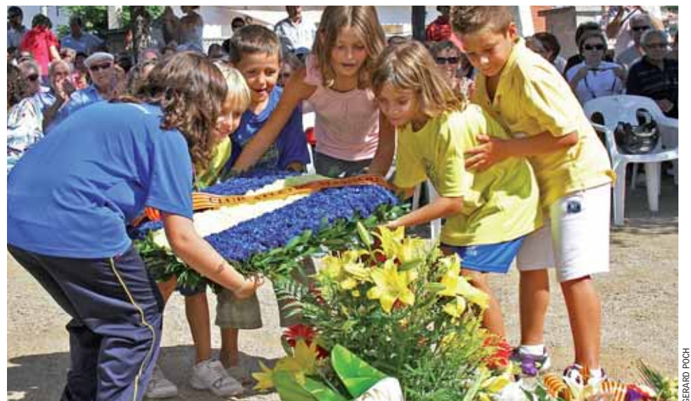
Les entitats del municipi també van participar en la tradicional ofrena floral.