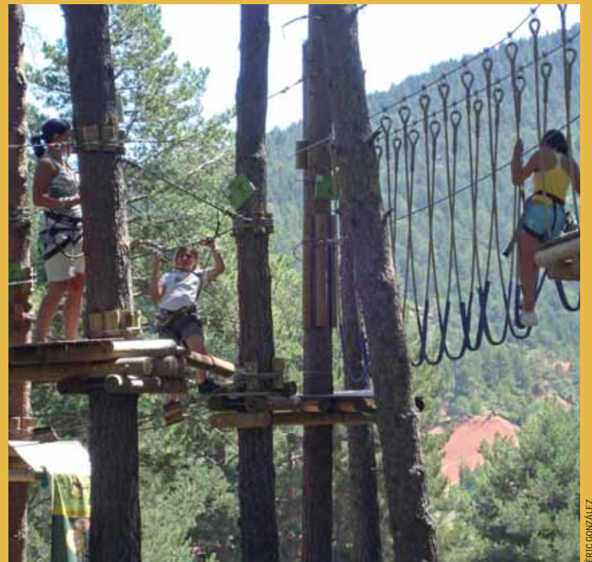
El Campus va incloure diverses sortides.

Enguany, el Campus Esportiu va comptar amb la participació de 260 nens i nenes durant tot el mes de juliol dividits en tres grups: petits, mitjans i grans. El Campus Esportiu es va dividir en dues quinzenes: la primera, del 5 al 16 de juliol, durant la qual hi van participar 140 infants, i la segona, del 19 al 30 de juliol, durant la qual hi van prendre part 120 nens i nenes. Les activitats es van realitzar al Complex Esportiu (piscina i pavelló), a la platja d'Ocata (Ocata Vent) i al Club Nàutic, i també hi va haver una sortida per a tothom a Navarcles i Saldes, ambdues activitats organitzades per la Diputació de Barcelona.