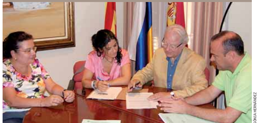
Moment de la signatura del conveni.

L'Ajuntament i el Departament de Governació i Administracions Públiques de la Generalitat han signat un acord per a la cessió del local ubicat al passeig de Prat de la Riba, 30 (on actualment es troba l'Oficina Local d'Habitatge) per instal·lar-hi una Oficina d'Acció Ciutadana. Aquest servei es troba-